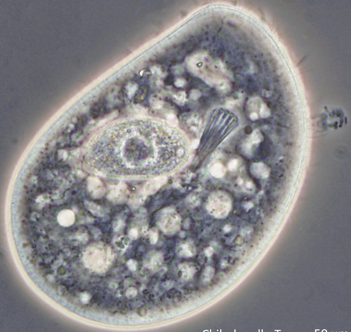
Chilodonella-Typ 50 µm